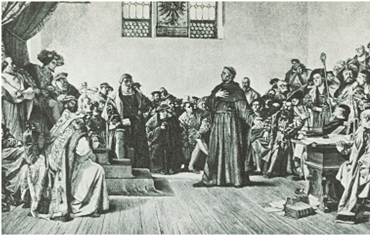
(Bild: Luther vor dem Reichstag in Worms, gemalt von Anton von Werner (1843-1915))

Die Ordnungen etlicher christlichen Gemeinden berufen sich auf das Evangelium von Jesus Christus, wie es im alten und neuen Testament bezeugt und "in den Bekenntnissen der Reformation neu ans Licht getreten" wird.