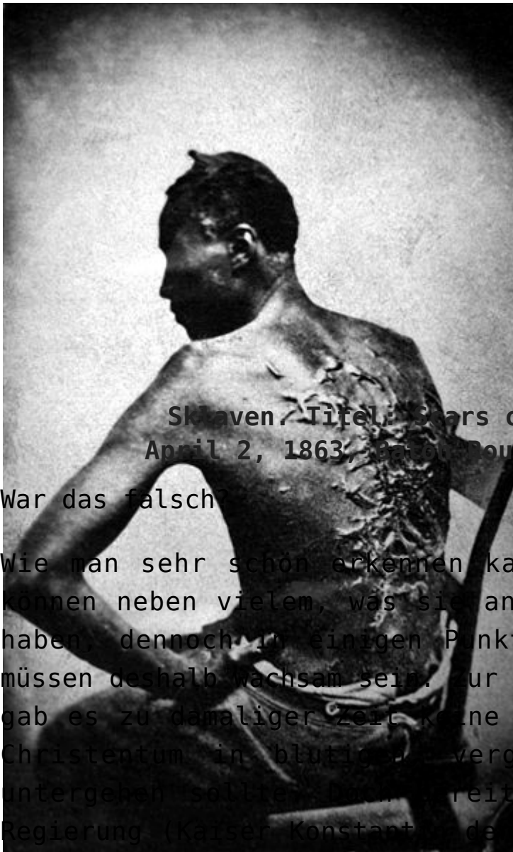
(Narben eines ausgepeitschten Sklaven / Title: Scars of a whipped slave; April 2, 1863, Baton Rouge, Louisiana, USA.)